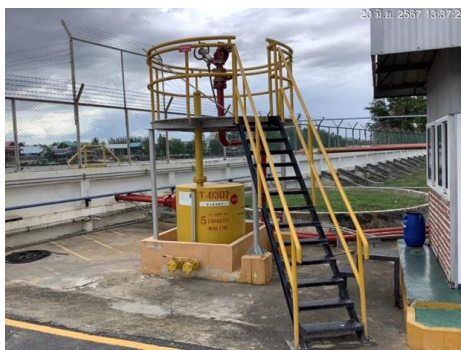
ภาพที่ 2-10 อุปกรณ์ดับเพลิงบริเวณหน้าท่า