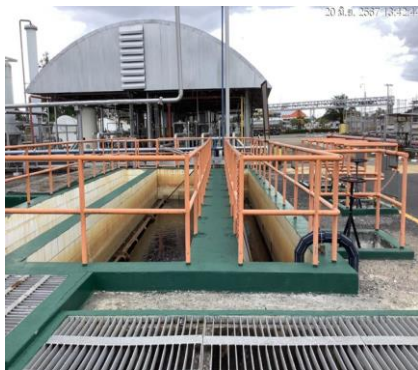
ภาพที่ 2-3 บ่อตกตะกอน (Collection pond)