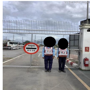
ภาพที่ 2-14 เจ้าหน้าที่รักษาความปลอดภัยบริเวณหน้าคลัง