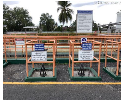
ปอดักน้ำมันลานถึงเก็บน้ำมัน