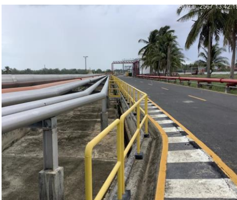
ภาพที่ 2-2 รางระบายน้ำคอนกรีตภายในคลัง