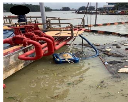
ภาพที่ 2-13 ภาพกิจกรรมซ้อมแผนหกั่วไหลของน้ำมัน ปี พ.ศ. 2566