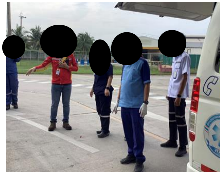
ภาพที่ 2-12 (ต่อ) ภาพกิจกรรมซ้อมแผนฉุกเฉิน ปี พ.ศ. 2566