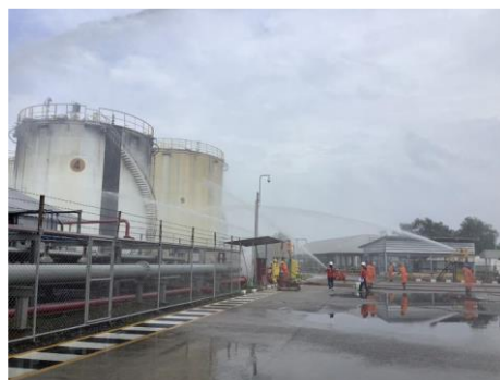
ภาพที่ 2-12 ภาพกิจกรรมซ้อมแผนฉุกเฉิน ปี พ.ศ. 2566