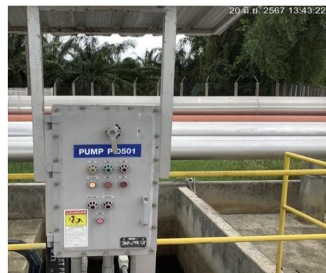
ปอดักน้ำมันบริเวณท่าเทียบเรือ