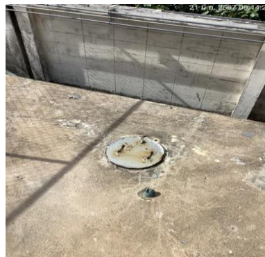
ภาพที่ 2-4 ระบบบำบัดน้ำเสียสำเร็จรูปแบบถัง SATS