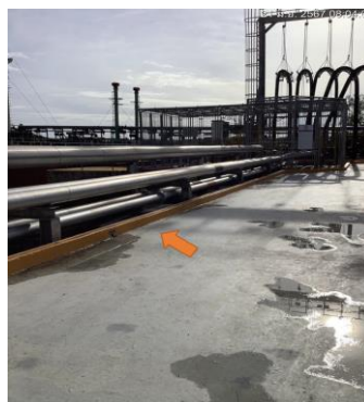
ภาพที่ 2-7 คั่นคอนกรีตสูง 0.10 เมตร บริเวณหน้าท่า