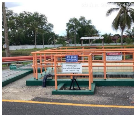
ปอดักน้ำมันบริเวณที่เดิมผลิตภัณฑ์