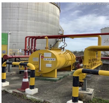
ภาพที่ 2-11 อุปกรณ์ดับเพลิงภายในคลัง