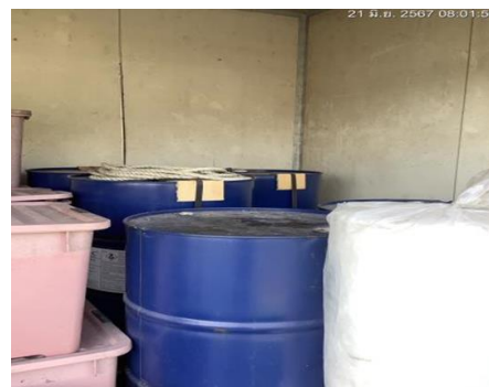
ภาพที่ 2-9 อุปกรณ์และเครื่องมือสำหรับกำจัดคราบน้ำมัน