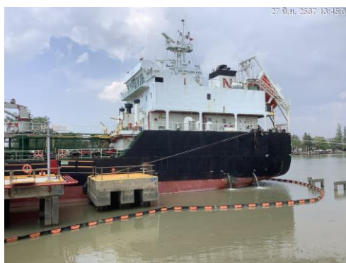
ภาพที่ 2-6 การล้อมทุ่น (Boom) รอบลำเรือบรรทุกน้ำมัน