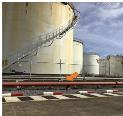
ภาพที่ 2-5 คันคอนกรีตสูง 1.00 เมตร ล้อมรอบลานถังเก็บน้ำมัน